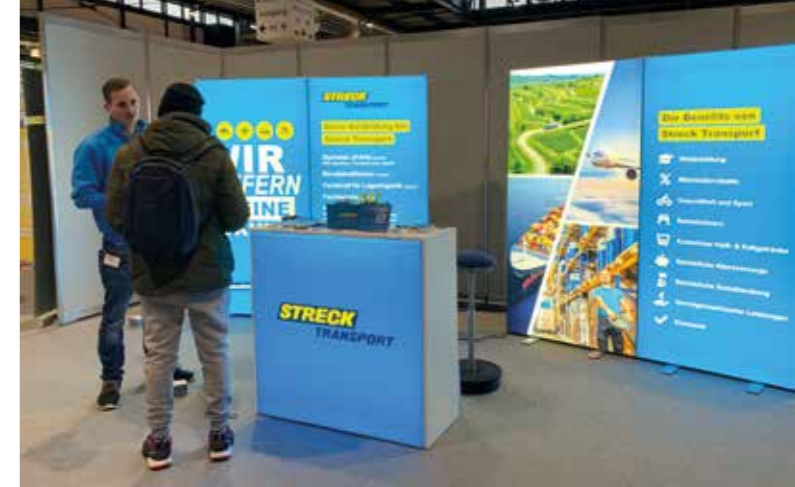
Der neue Messestand von Streck Transport in Deutschland fällt den zukünftigen Auszubildenden sofort ins Auge